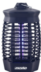
MOSQUITO KILLER LAMP MS 7933