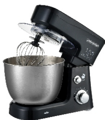
MIXER WITH BOWL MS 4217