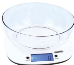
KITCHEN SCALE MS 3165