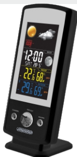
Weather Station MS 1177