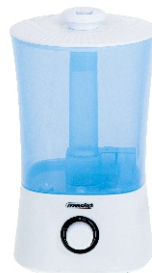
AIR HUMIDIFIER MS 7965