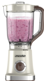
BLENDER WITH JAR MS 4079