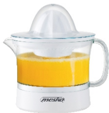
CITRUS JUICER MS 4010